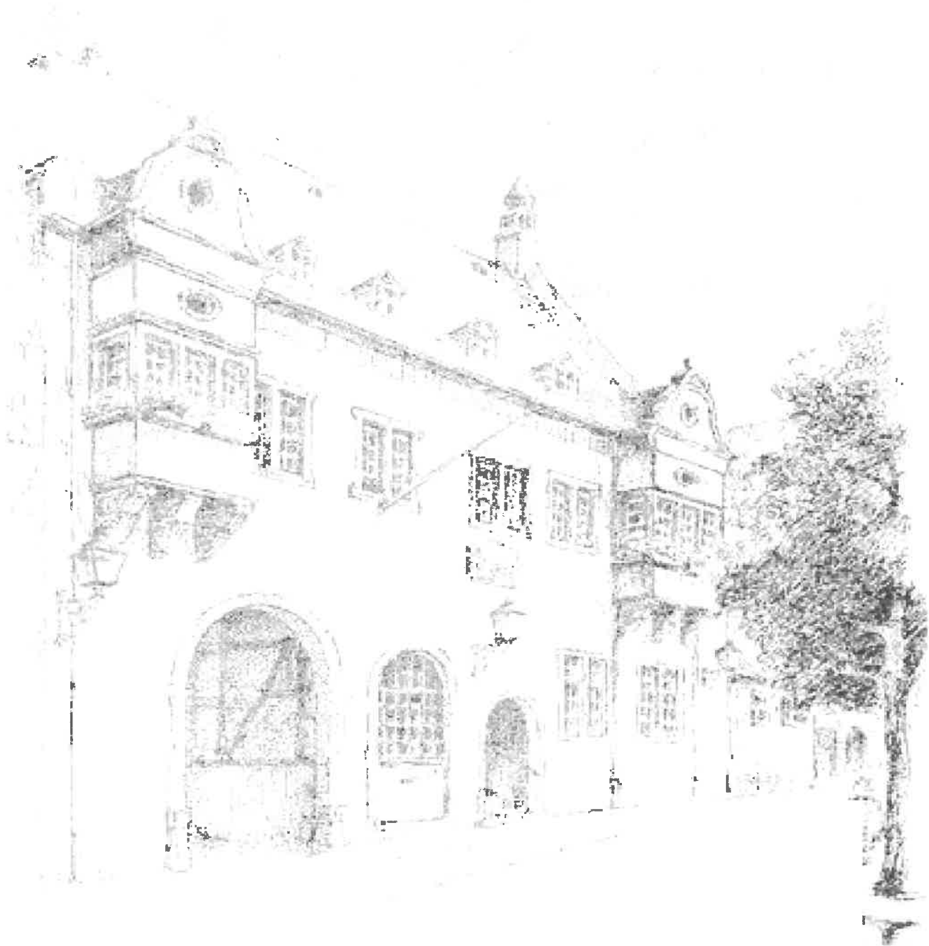
Niedricher Rathaus von 1585