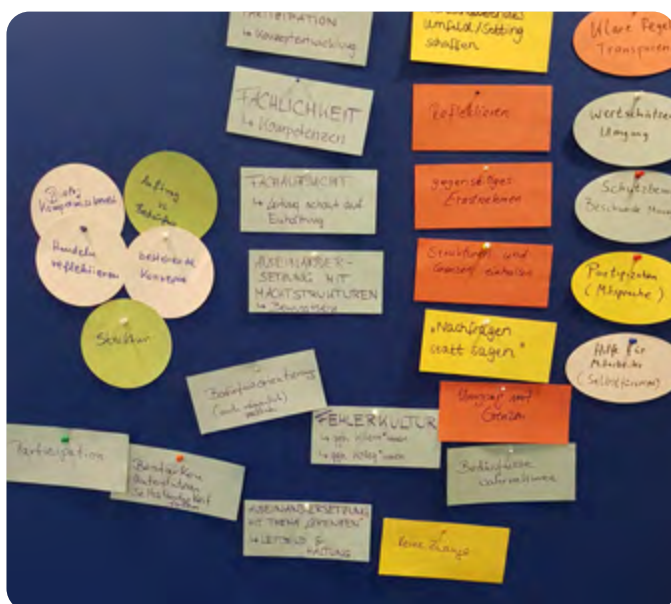
Ergebnisse aus Kleingruppenarbeiten