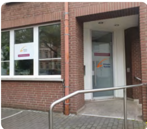
Eingangsbereich in der Dostojewskistraße